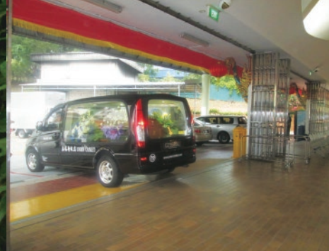
▲ 光明山普覺禪寺火化場