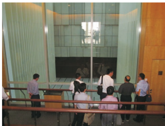
▲ 大體火化滑軌觀看臺