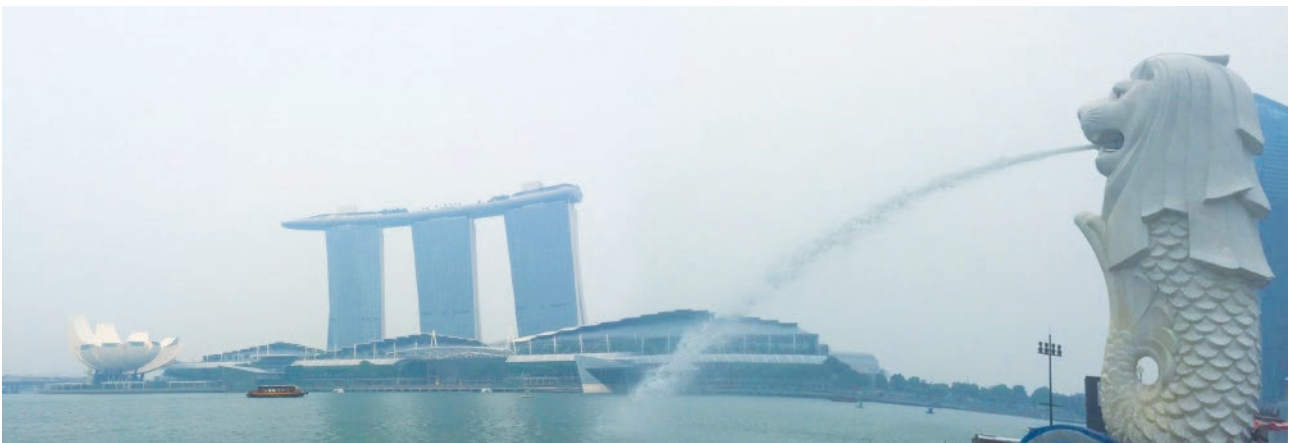
▲ 新加坡人均 GDP 從 1965 年的 516 美元一路攀升至 2014 年的 5 萬 6,287 元成長一百多倍

新加坡自1965年獨立以來，已成為全球最國際化的國家之一，也是全球經濟成長最快速的國家之一，是個多元文化種族的國家，多樣化的組成不僅語言不同、宗教信仰、習慣與價值觀皆大為迥異，如此多樣化的組成背景，總讓人聯想時常帶來衝突、誤解與生產力降低，但這些不同族群都把新加坡當成自己的家鄉，對各先人傳承下來的文化與智慧都十分珍惜，反而為國家帶來多元觀點的契機。