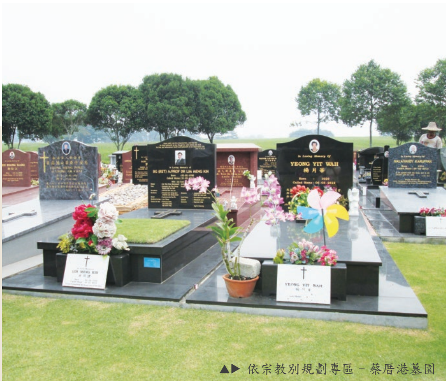
▲► 依宗教別規劃專區 - 蔡厝港墓園

註：宗教因素無法選擇的費用 10 歲以下小孩為 140 新幣 (NT 3,210)、大人 315 新幣 (NT 7,223)；可選擇火葬但選擇土葬者費用則為 10 歲以下小孩 420 新 (NT 9,631)、大人 940 新幣 (NT 21,554)，皆是依序埋葬不得選位。