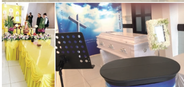
▲ 依宗教需求佈置告別式場