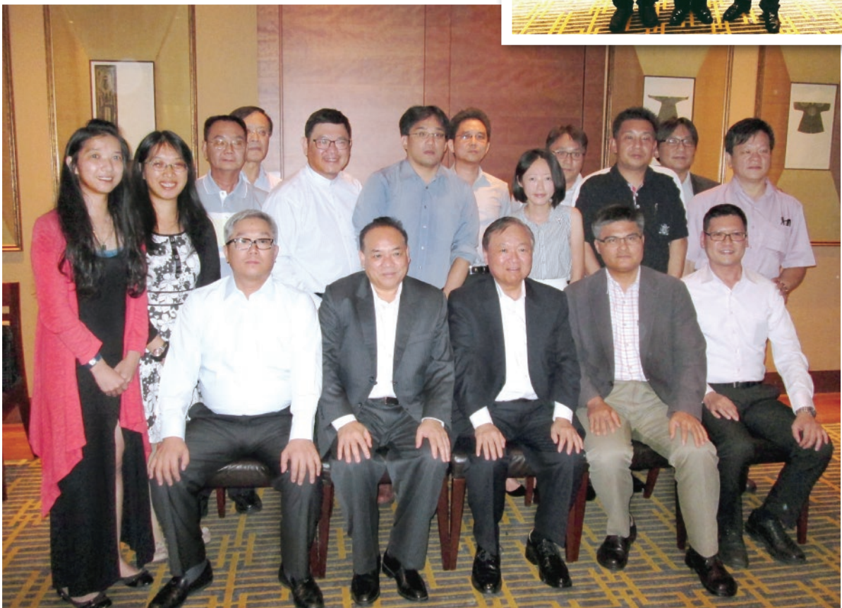
▲參訪團與駐新加坡臺北代表處張大使合影