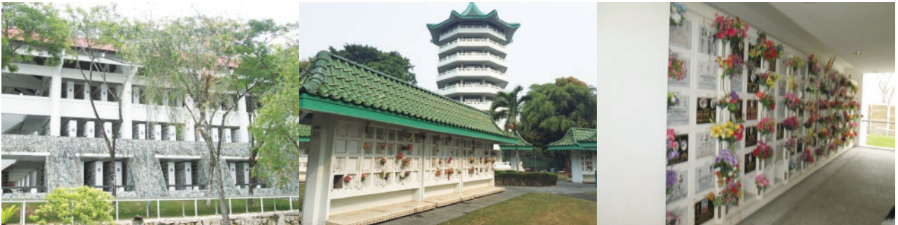
▲ 新加坡萬里、翡瓏山聖公塔

新幣 (NT 20,637)，公塔是按順序分配，如欲選位將須支付 250 新幣 (NT 5,733) 的選位費；私塔的費用以宏船老和尚所住持之光明山普覺禪寺為例，預售位價格自 1,600 新幣 (NT 36,688) 起、現用位價格自 1,200 新幣 (NT 27,516) 起，而牌位則自 3,580 新幣 (NT 82,089) 起。