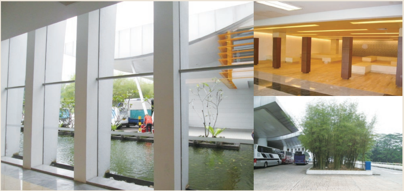
▲ 家屬等待大廳及週邊環境